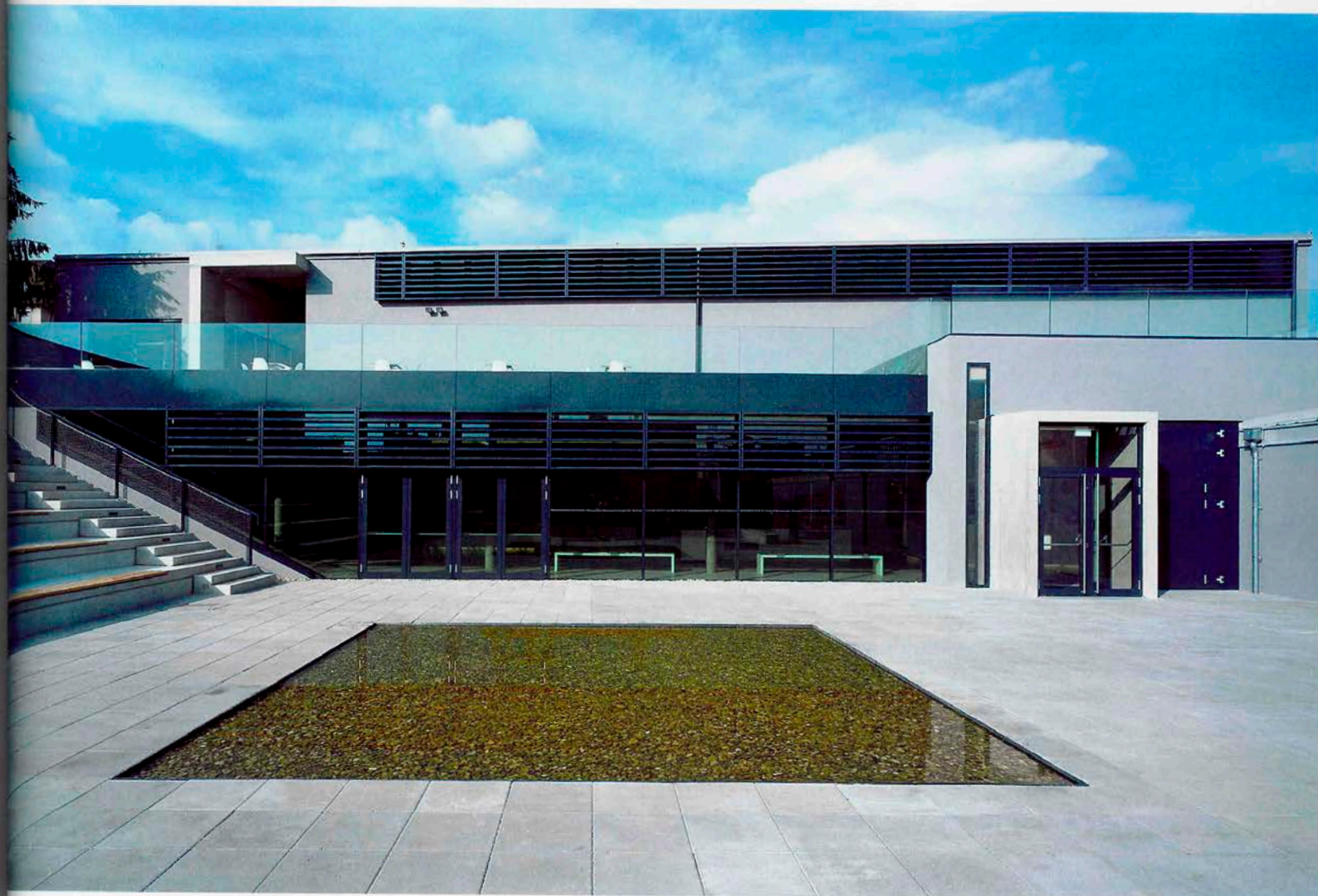
Vor dem Eingang öffnet sich die Piazza mit Sitzterrasse, wo Film- und Videovorführungen geplant sind